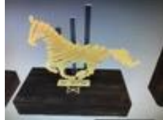
5.1.4. Tipo IV - Layout CBH-T4: