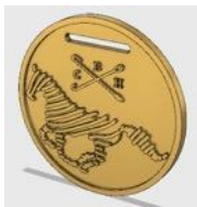
5.2.1. Tipo I - Layout CBH-M1:

5.2. MEDALHAS - Os layouts das medalhas estão disponíveis no formato 3D no link http://a360.co/2nTguNQ