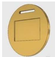
5.2.2. Tipo II- Layout CBH-M2: