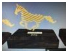
5.1.3. Tipo III - Layout CBH-T3: