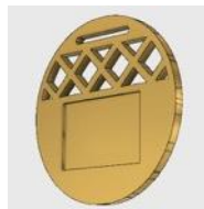
5.2.3. Tipo III- Layout CBH-M3: