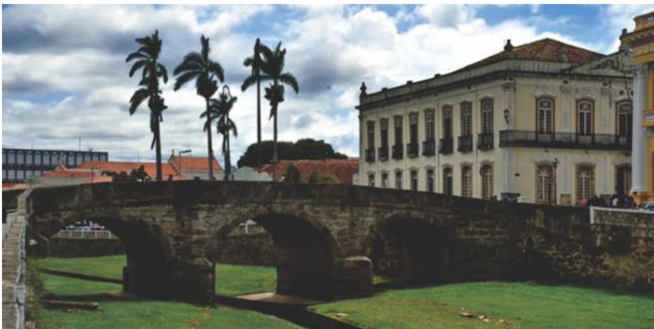
SÃO JOÃO DEL REI – 61Km (BR265, sentido Lavras)